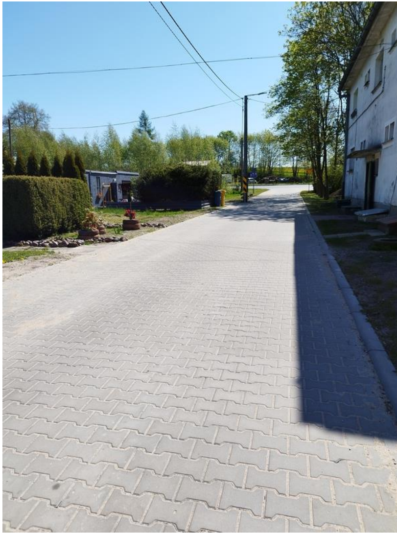
ulica Osiedlowa, Rymanów

4. „Przebudowa pętli autobusowej z ulicą Szkolną w Rymaniu ” zadanie zrealizowane w ramach Rządowego Funduszu Polski Ład: Program Inwestycji Strategicznych. Wartość zadania