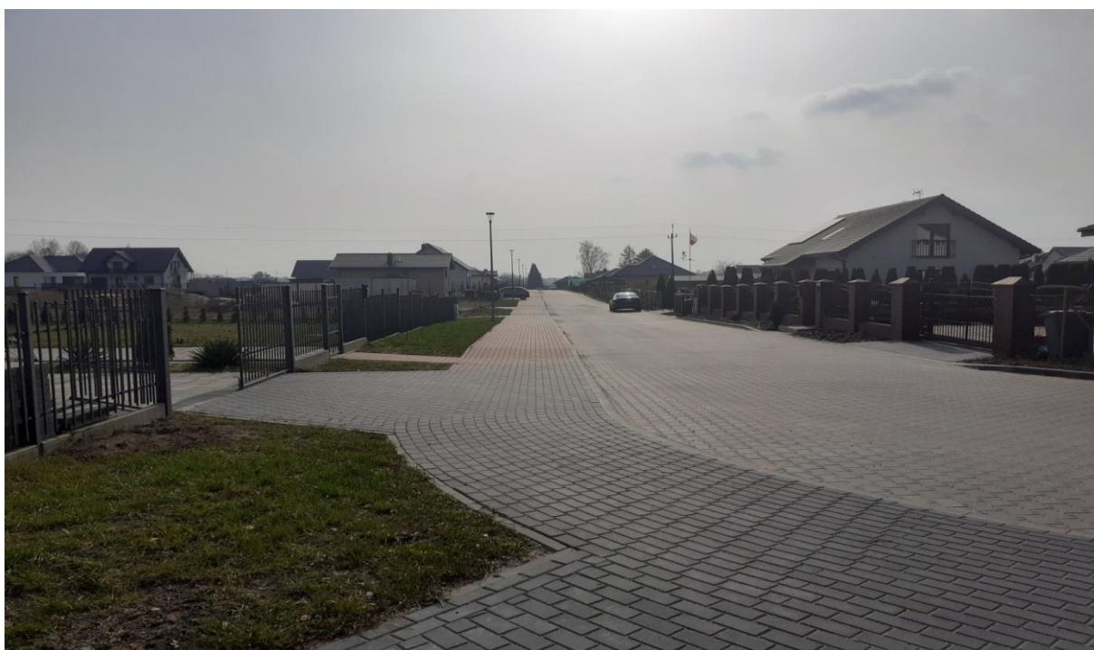
ulica Wrzosowa, Rymanów