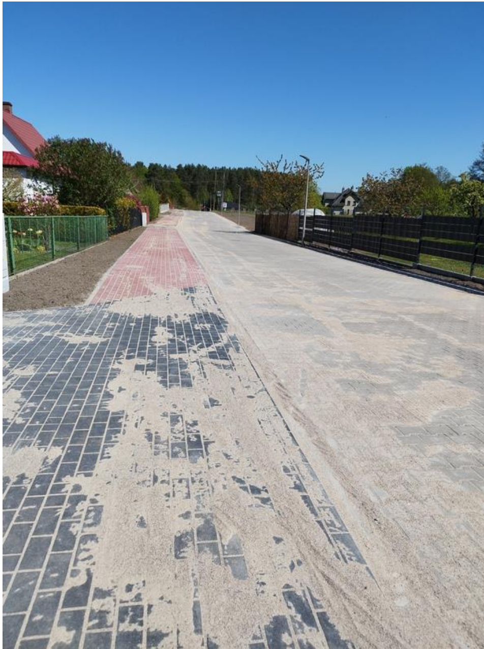
ulica Krótka, Rymanów