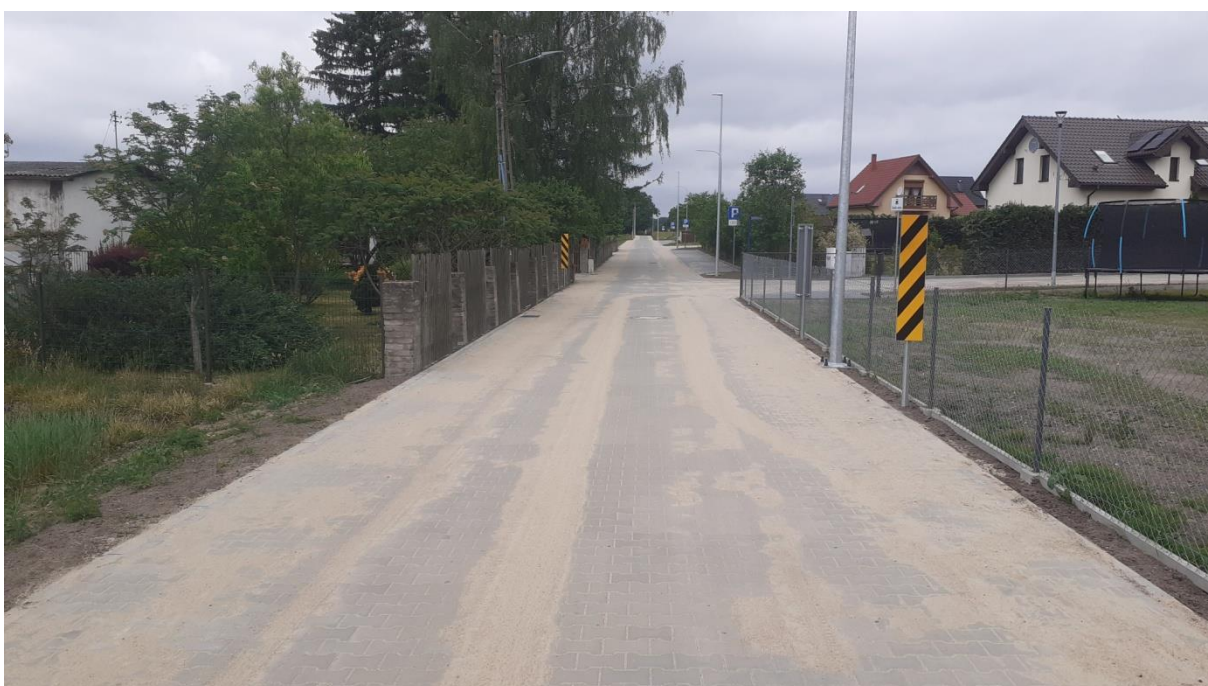
ulica Słoneczna, Rymań

Wartość zadania 2 070 000,00 zł, dofinansowanie 1 966 500,00 zł.