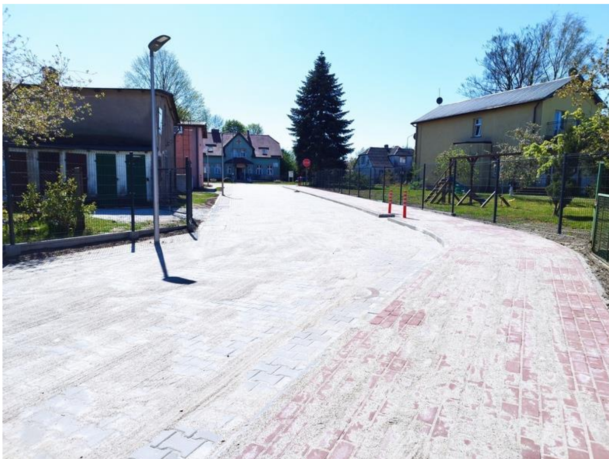
ulica Krótka, Rymań

Dofinansowanie projektu w zł: 1.518.693,65