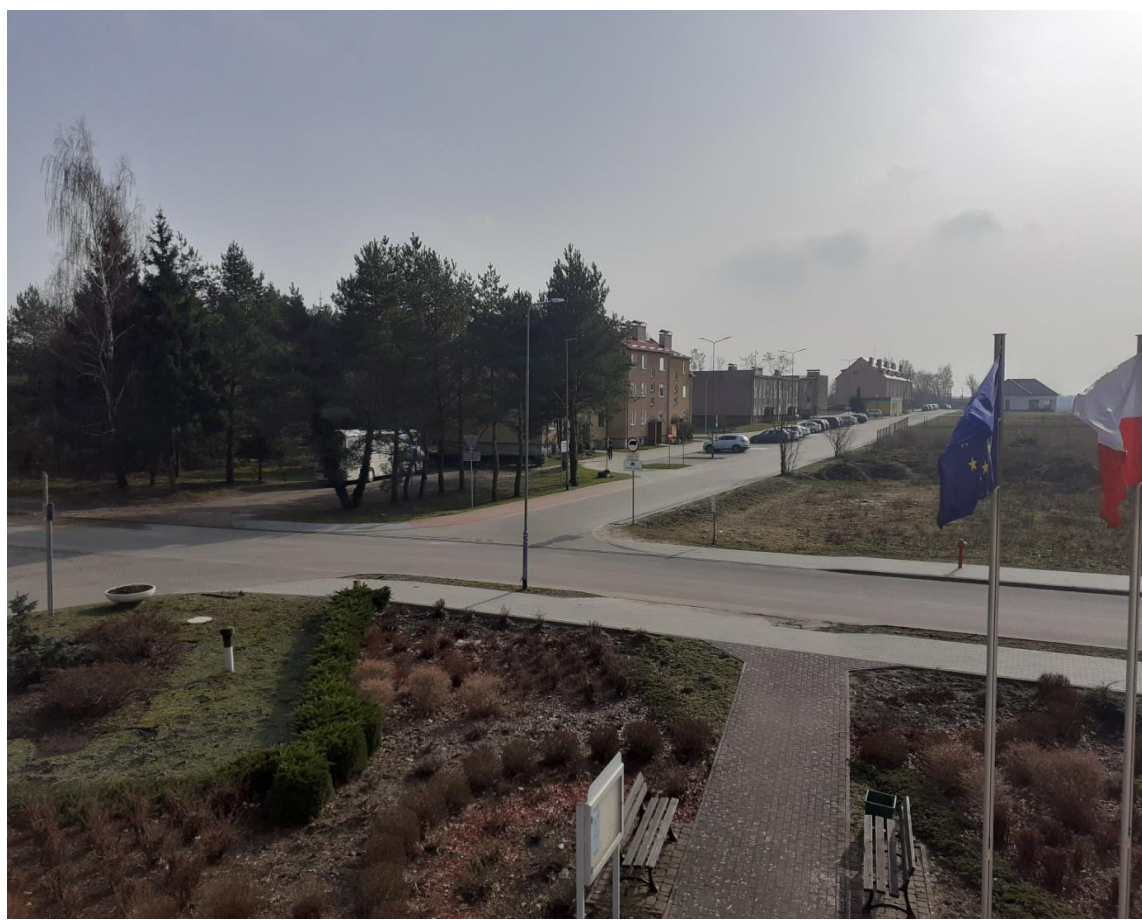
ulica Polna, Ryman

Dofinansowanie projektu w zł: 1.803.338,93.