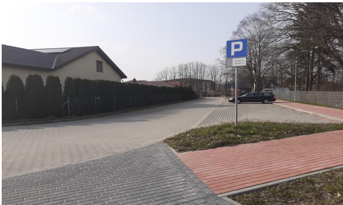
ulica Wrzosowa, Rymanów