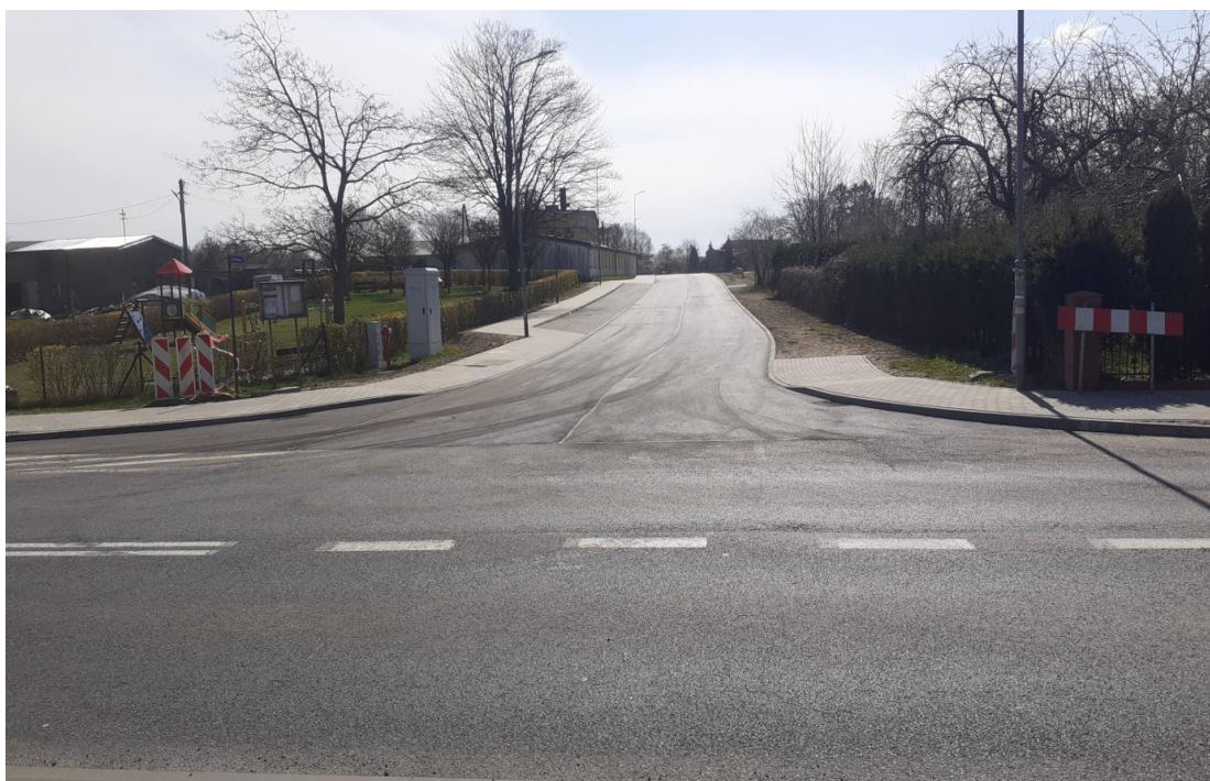
ulica Nowa, Rymań

Wartość zadania 2 826 933,26 zł, dofinansowanie 2 685 586,60 zł