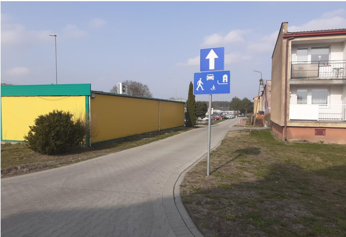
ulica Polna, Rymanów