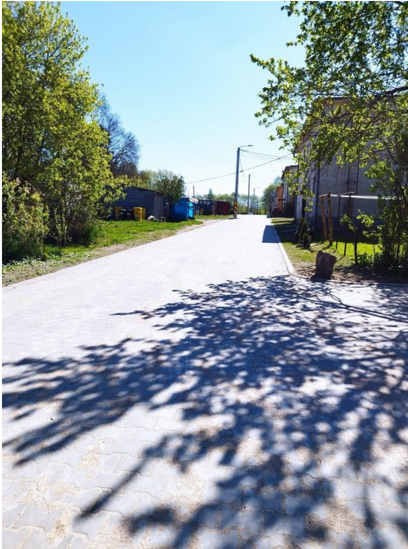
ulica Osiedlowa, Rymanów