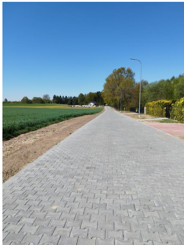
ulica Szkolna, Rymań