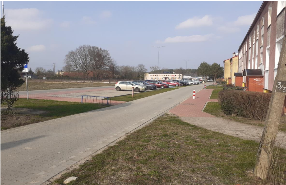
ulica Polna, Rymanów