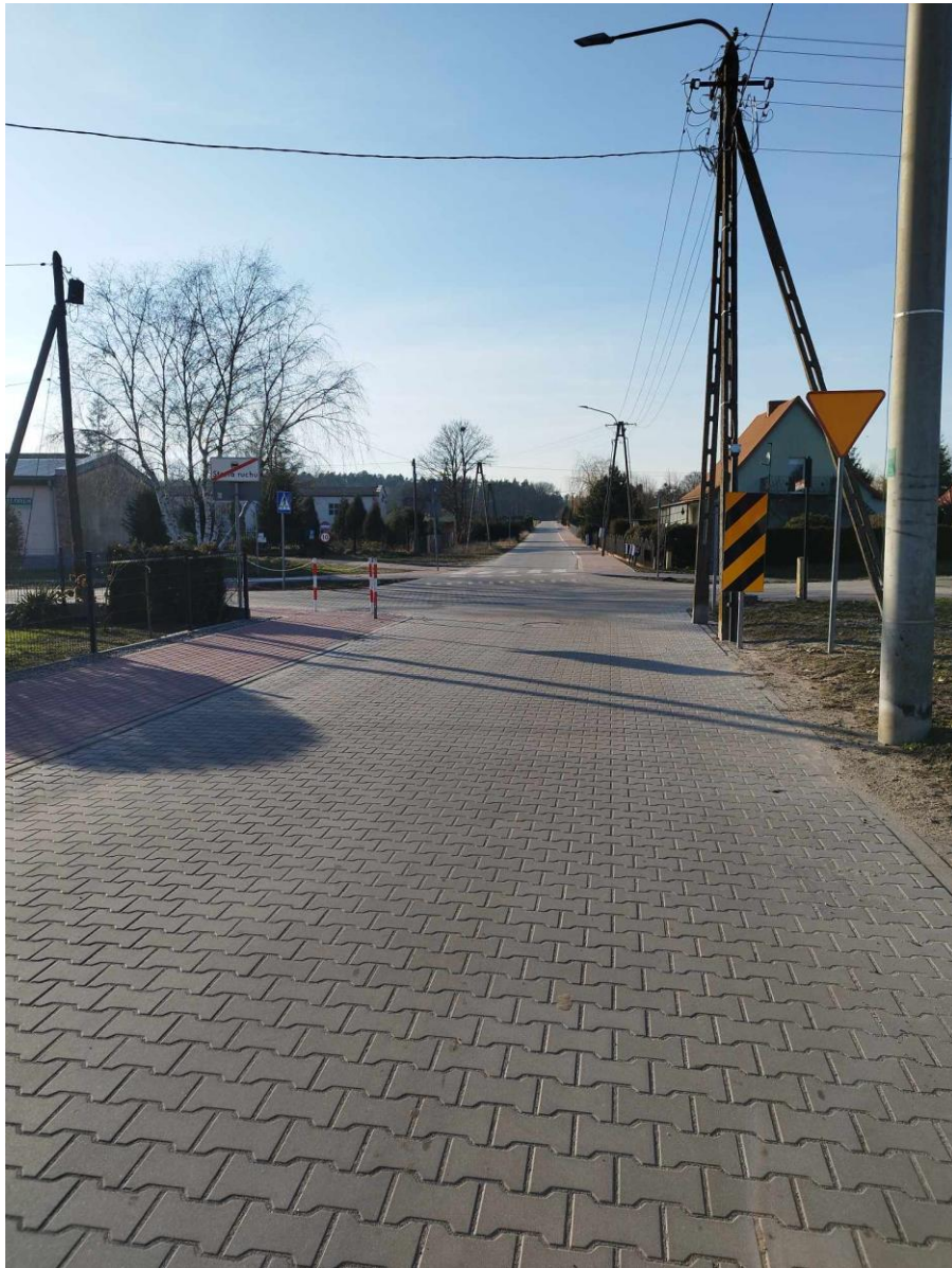
ulica Wiejska, Rymanów