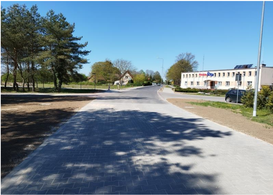
ulica Szkolna, Rymań