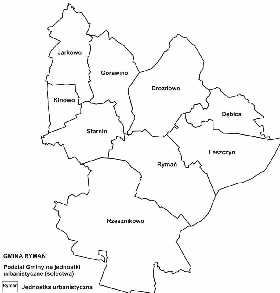
Podział Gminy na jednostki urbanistyczne (sołectwa)